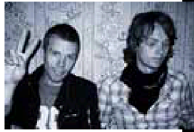
foto Black Belt: Frank Aschberg foto [jingtjng]: Henrik Mårtensson foto Emil Jensen: Paul Ström foto The Models: Dominique Kalamajsky